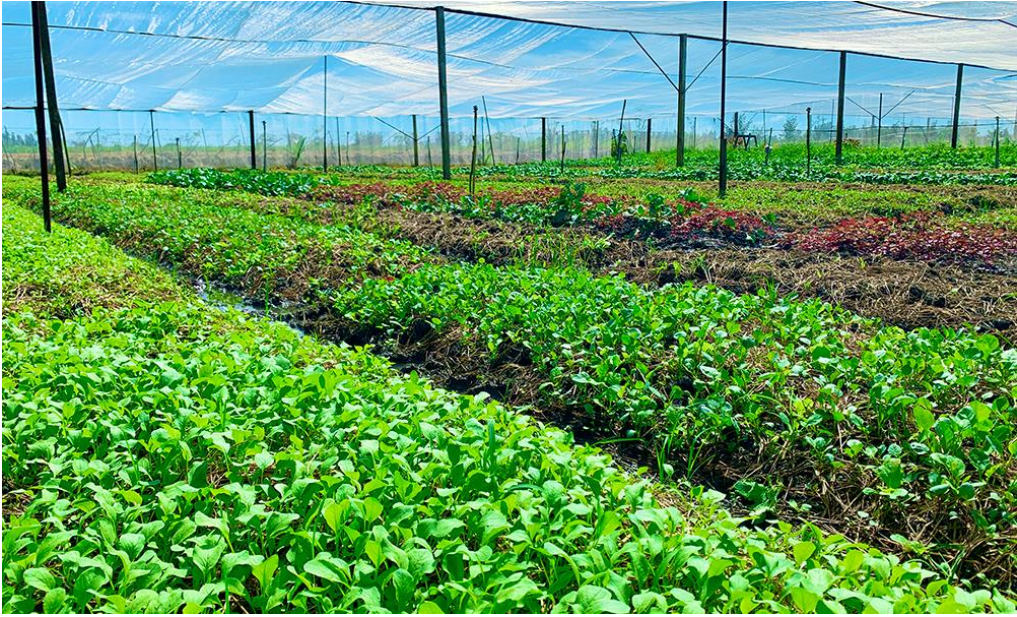
Canh tác rau màu trong nhà lưới ở huyện Chợ Mới