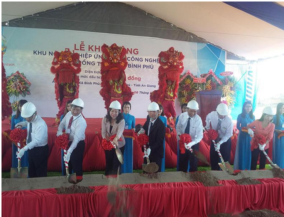
Lễ khởi công Khu nông nghiệp ứng dụng công nghệ cao nuôi trồng thủy sản Bình Phú ở huyện Châu Phú năm 2019