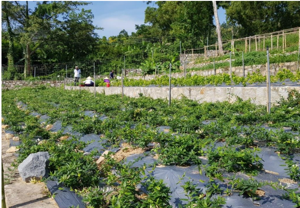
Trồng dược liệu tại khu bảo tồn kết hợp phát triển du lịch tại núi Cấm, tỉnh An Giang