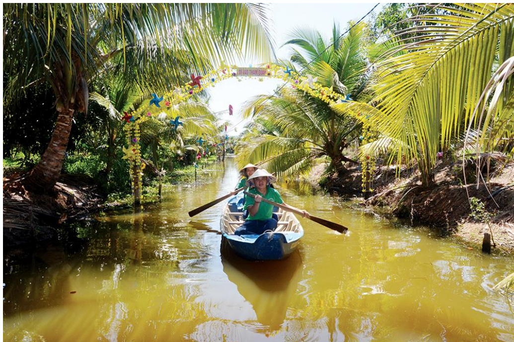
Bơi xuồng tham quan trong vườn sinh thái Út Cung ở TP. Châu Đốc