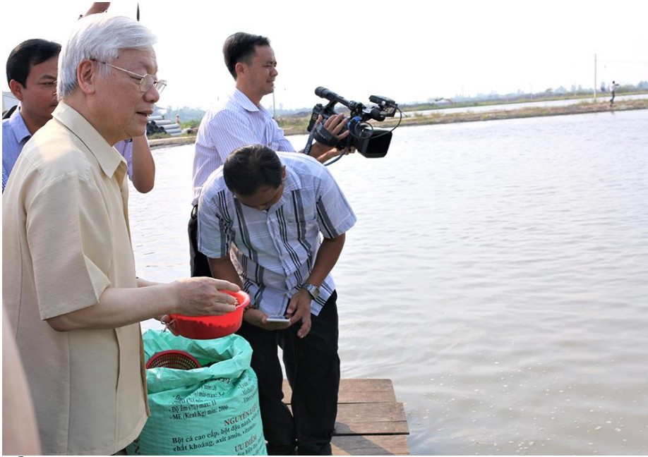
Tổng Bí thư Nguyễn Phú Trọng tham quan mô hình nuôi cá tra của Công ty Lộc Kim Chi tại huyện Châu Phú vào tháng 4-2018