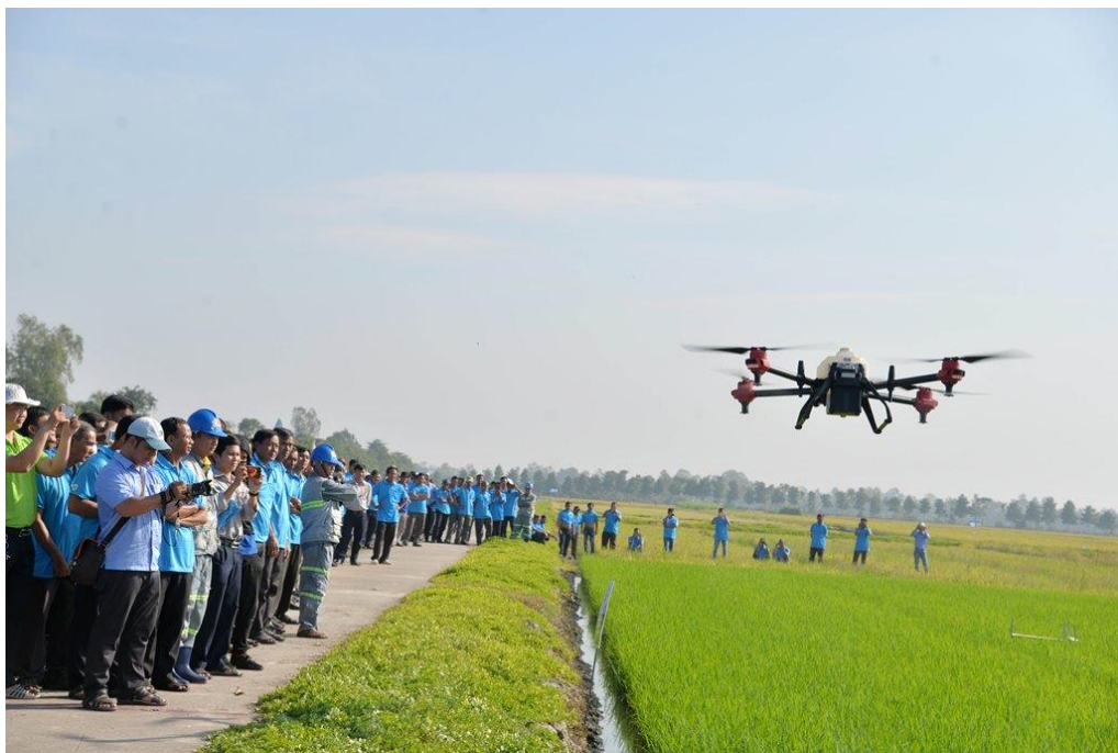
Kỹ sư Tập đoàn Lộc Trời thực nghiệm drone phun thuốc trên vùng nguyên liệu ở huyện Thoại Sơn cho nông dân