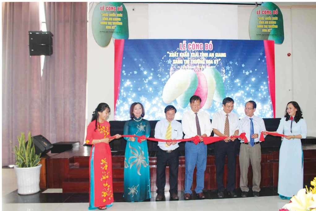
Lễ công bố xuất khẩu lô xoài đầu tiên của tỉnh sang thị trường Hoa Kỳ