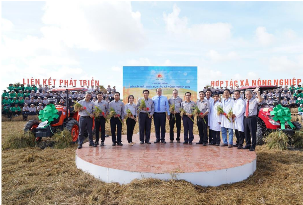
Lễ ký kết hợp tác giữa UBND tỉnh An Giang và Tập đoàn Lộc Trời