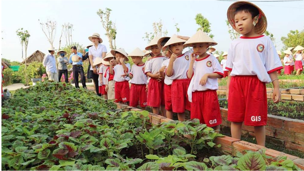
Học sinh trải nghiệm tại Nông trại Phan Nam, xã Mỹ Khánh, TP. Long Xuyên