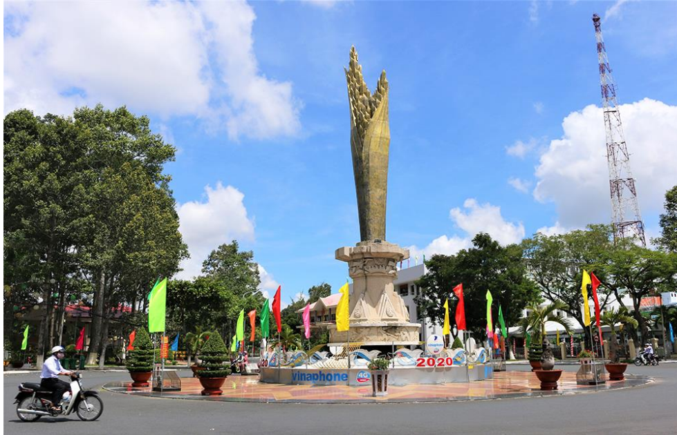
Tượng đài bông lúa trước trụ sở UBND tỉnh An Giang