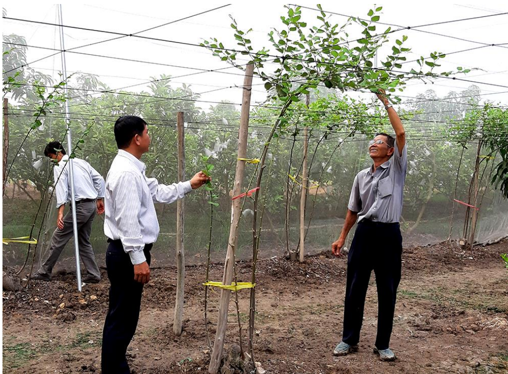
Trồng táo trong nhà lưới ở xã Mỹ Phú, huyện Châu Phú