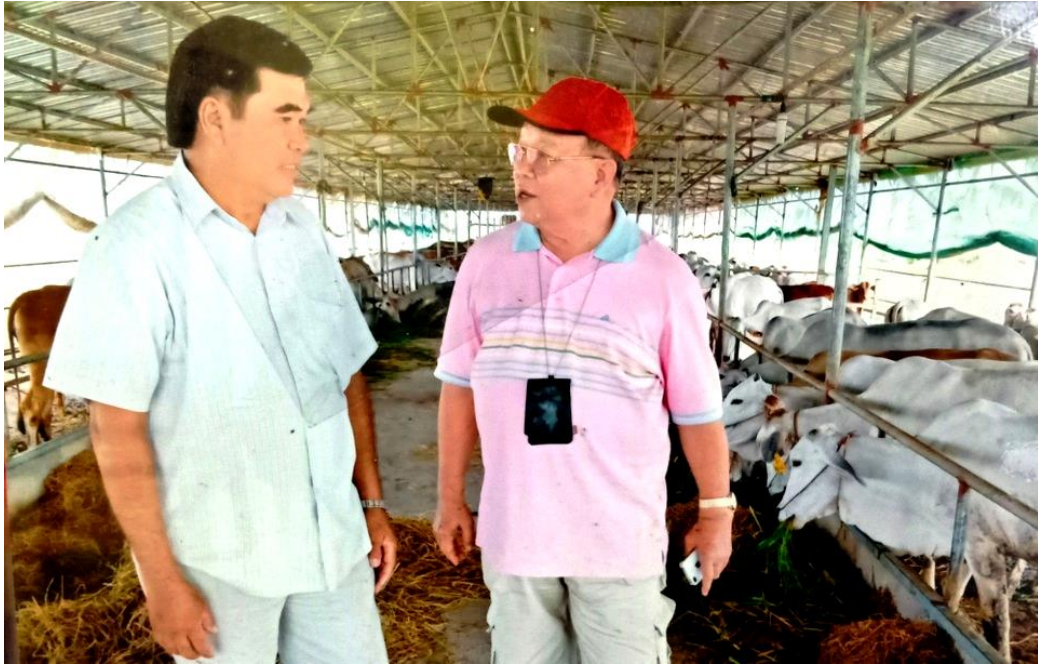
Nông dân Sáu Đức với GS.TS Võ Tòng Xuân tại trang trại bò giống ở huyện Tri Tôn