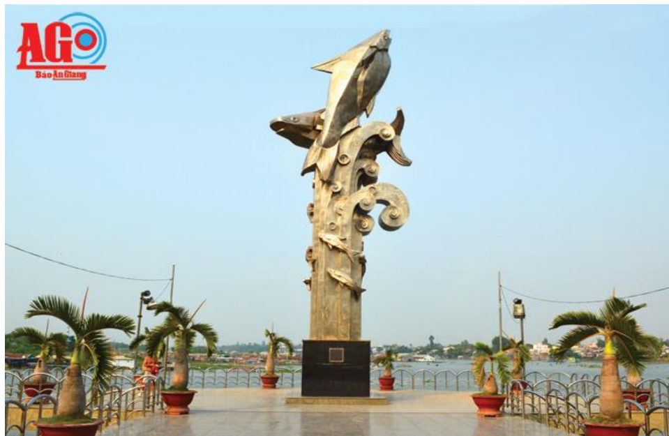
Tượng đài cá basa ở ngã ba sông Châu Đốc