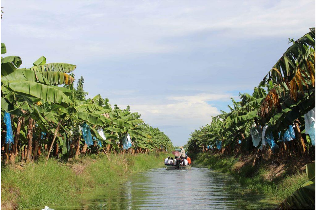
Trang trại trồng chuối cây mô ở huyện Tri Tôn